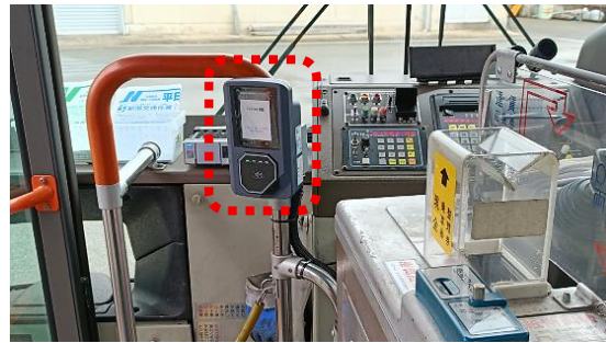
降車時のタッチ決済機器 設置イメージ