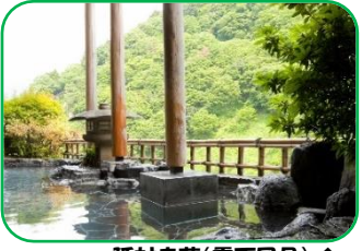
延対寺荘(露天風呂)↑