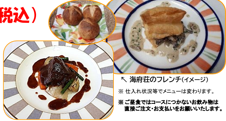
海府荘のフレンチ(イメージ) ※ 仕入れ状況等でメニューは変わります。 ※ ご昼食ではコースにつかないお飲み物は直接ご注文・お支払いをお願いいたします。

本年は節目となる第20回を迎える「相川ひなまつり」。今回は外海府の集落のひなまつりをご見学、大好評の海府荘さんのフレンチをお楽しみいただくツアーを企画いたしました。さらに、素敵な水引作品を制作・販売されている「COCO_SUGAR」さんのワークショップにて、お好みの水引キーホルダーをお作りいただけます。今年も外海府のおひなさまを訪ねて出かけてみませんか？