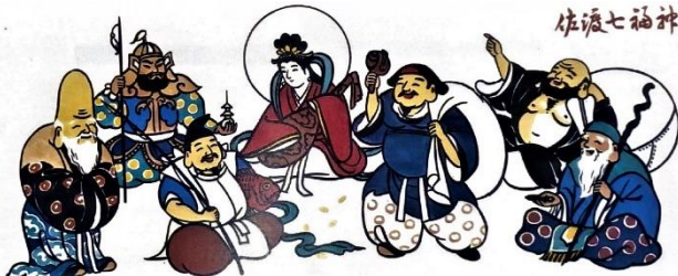
佐渡七福神(イメージ)